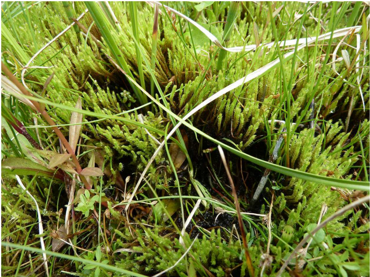
Porost Philonotis calcarea (PR Opatovské zákopy).