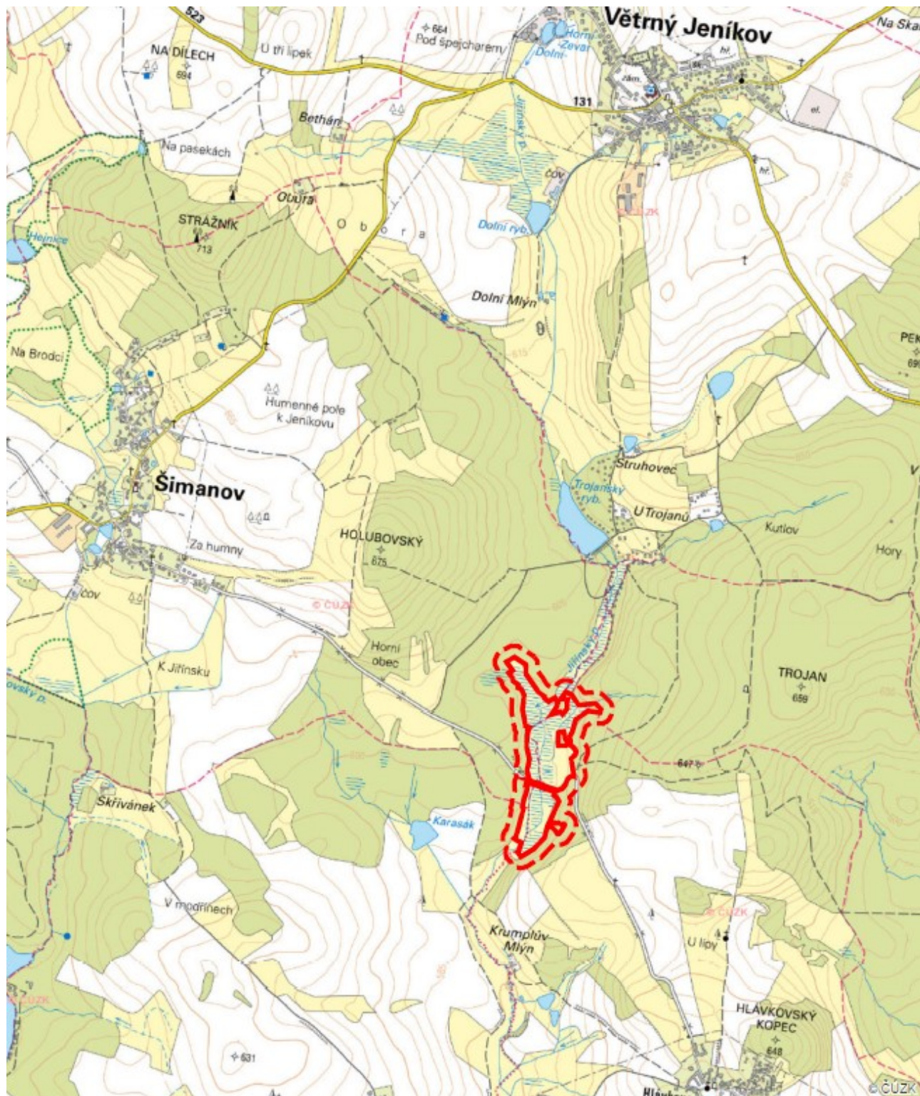
Obr. 1: PR Rašeliště pod Trojanem leží v nivě Jiřínského potoka mezi Větrným Jeníkovem, Šimanovem a Hlávkovem v okrese Jihlava v Kraji Vysočina.