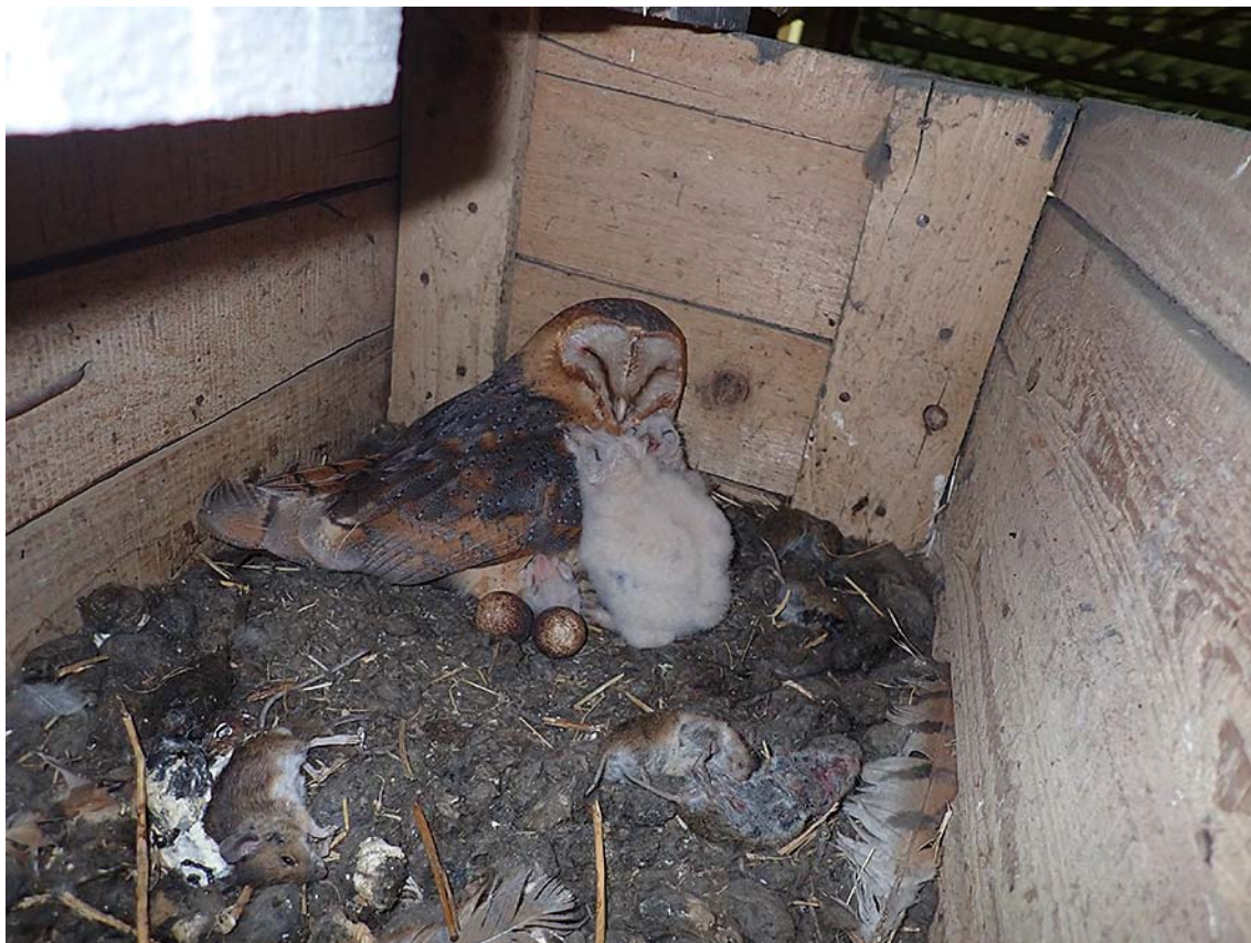
Mláďata sovy pálené ( Tyto alba ), okres Louny, budka Sova pálená č. 1947.

Společně pro zelenou Evropu Tento projekt byl podpořen grantem z Norských fondů.