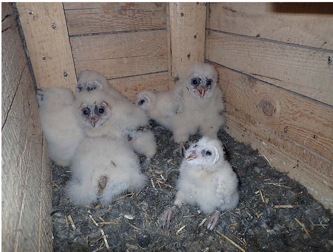
Mláďata sovy pálené ( Tyto alba ), okres Kladno, budka Sova pálená č. 5068.