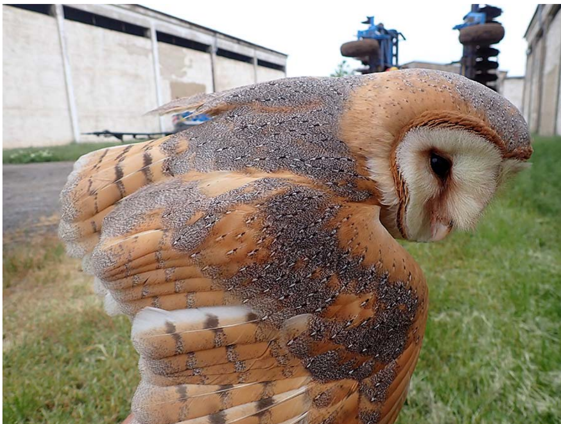
Dospělá hnízdící sova pálená ( Tyto alba ), okres Kladno, budka Sova pálená č. 1499.

Společně pro zelenou Evropu Tento projekt byl podpořen grantem z Norských fondů.