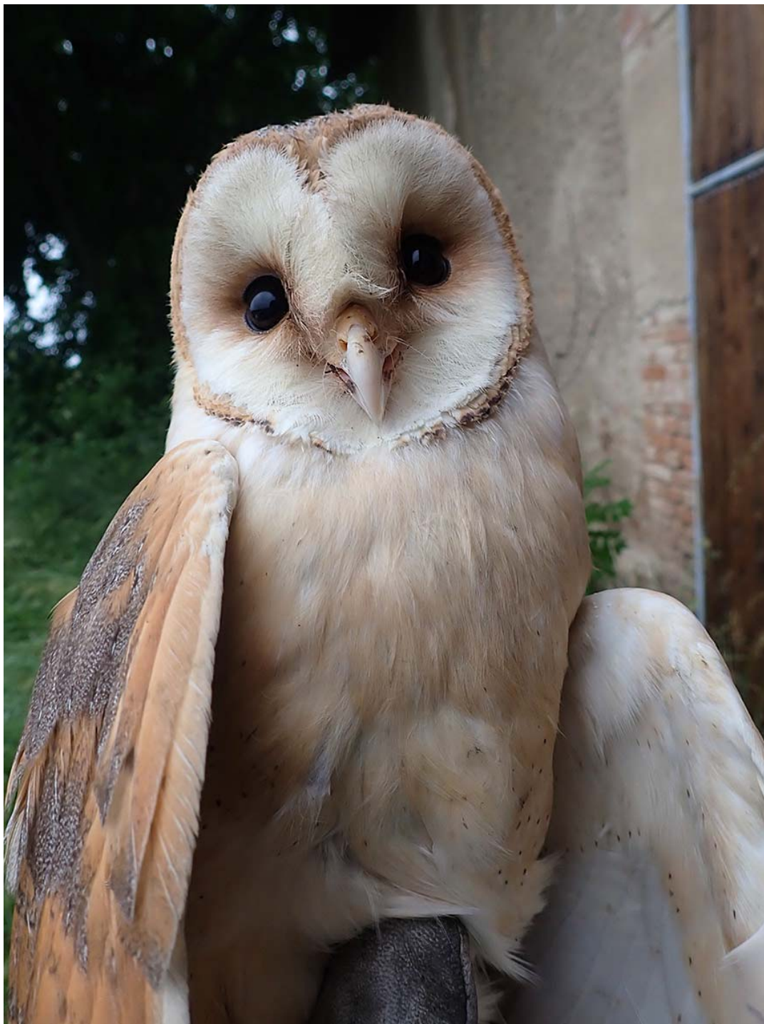
Dospělá hnízdící sova pálená ( Tyto alba ), okres Kladno, budka Sova pálená č. 1521.

Společně pro zelenou Evropu Tento projekt byl podpořen grantem z Norských fondů.