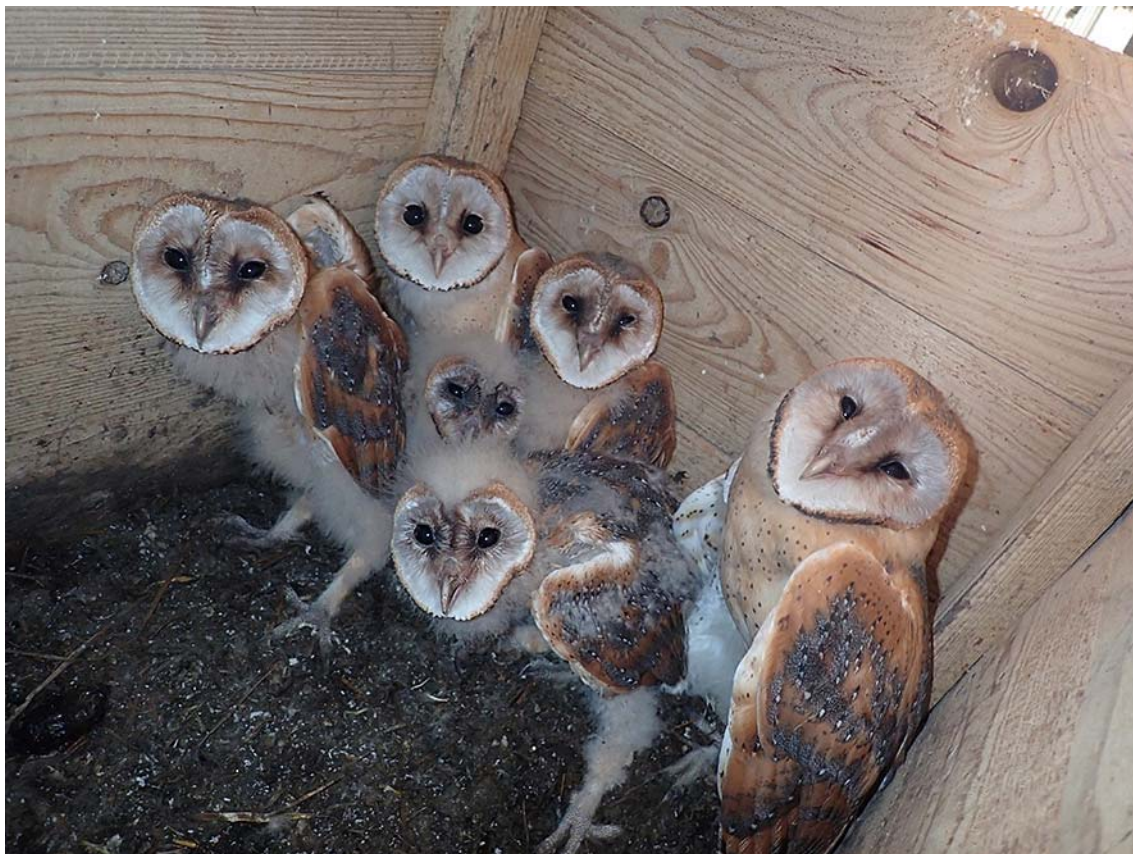
Mláďata sovy pálené ( Tyto alba ) v hnízdní budce po vyčištění a doplnění výstelky, okres Litoměřice, budka Sova pálená č. 4744.

Společně pro zelenou Evropu Tento projekt byl podpořen grantem z Norských fondů.