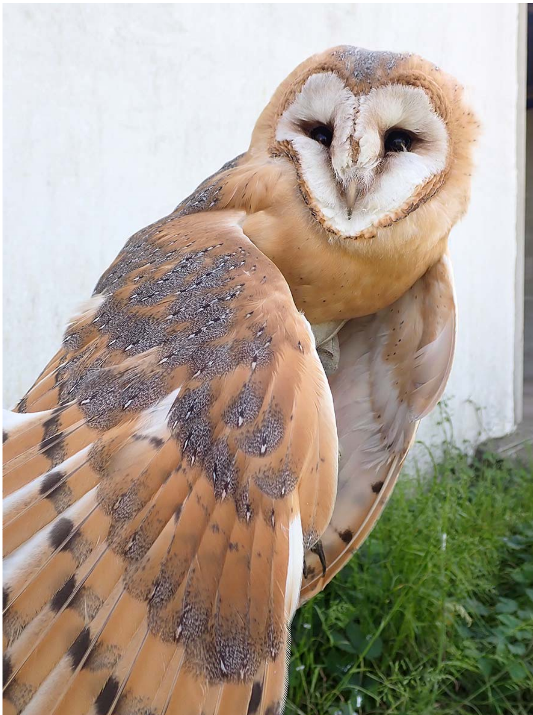
Plně opeřené mládě sovy pálené ( Tyto alba ), okres Kladno, budka Sova pálená č. 4965.

Společně pro zelenou Evropu Tento projekt byl podpořen grantem z Norských fondů.