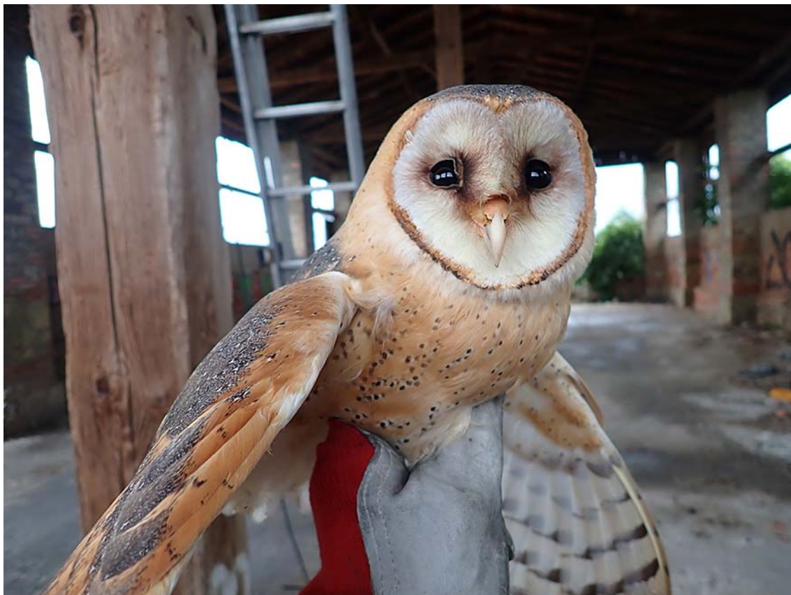
Dospělá hnízdící sova pálená ( Tyto alba ), okres Louny, budka Sova pálená č. 4720.

Společně pro zelenou Evropu Tento projekt byl podpořen grantem z Norských fondů.