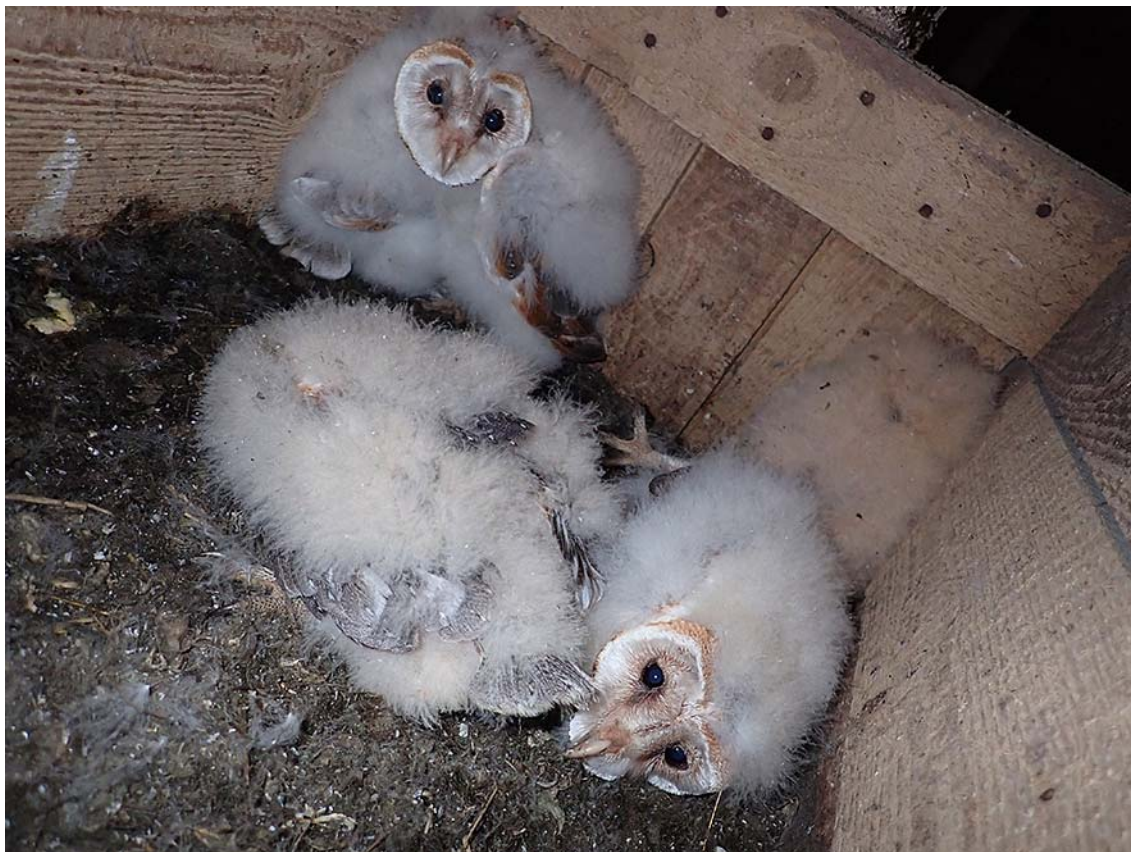
Mláďata sovy pálené ( Tyto alba ) v hnízdní budce po vyčištění a doplnění výstelky, okres Louny, budka Sova pálená č. 4964.

Společně pro zelenou Evropu Tento projekt byl podpořen grantem z Norských fondů.