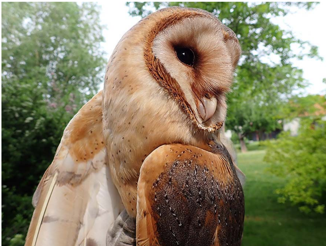
Dospělá hnízdící sova pálená ( Tyto alba ), okres Louny, budka Sova pálená č. 4948.

Společně pro zelenou Evropu Tento projekt byl podpořen grantem z Norských fondů.