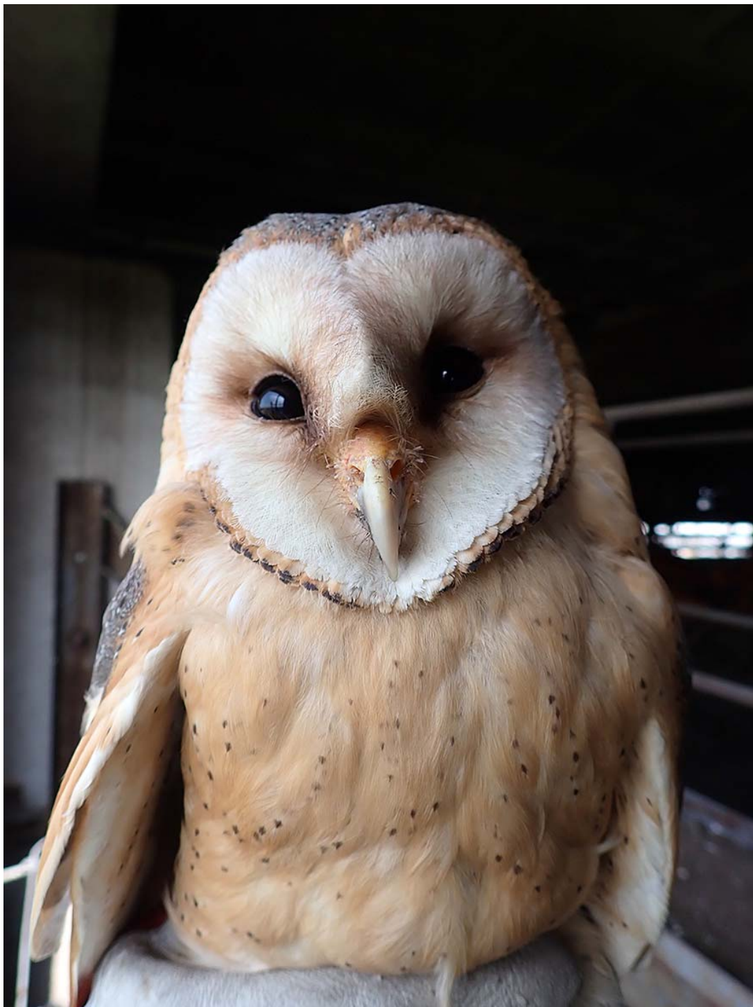
Dospělá hnízdící sova pálená ( Tyto alba ), okres Nymburk, budka Sova pálená č. 2456.

Společně pro zelenou Evropu Tento projekt byl podpořen grantem z Norských fondů.