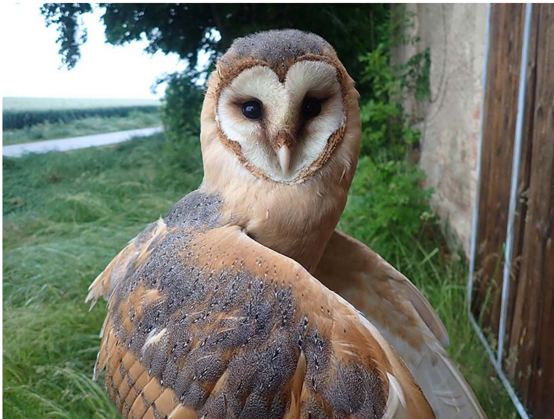
Dospělá hnízdící sova pálená ( Tyto alba ), okres Kladno, budka Sova pálená č. 1521.

Společně pro zelenou Evropu Tento projekt byl podpořen grantem z Norských fondů.