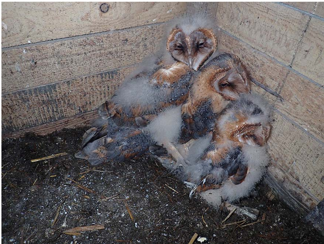
Mláďata sovy pálené ( Tyto alba ) v hnízdní budce po vyčištění a doplnění výstelky, okres Praha-východ, budka Sova pálená č. 3097.

Společně pro zelenou Evropu Tento projekt byl podpořen grantem z Norských fondů.