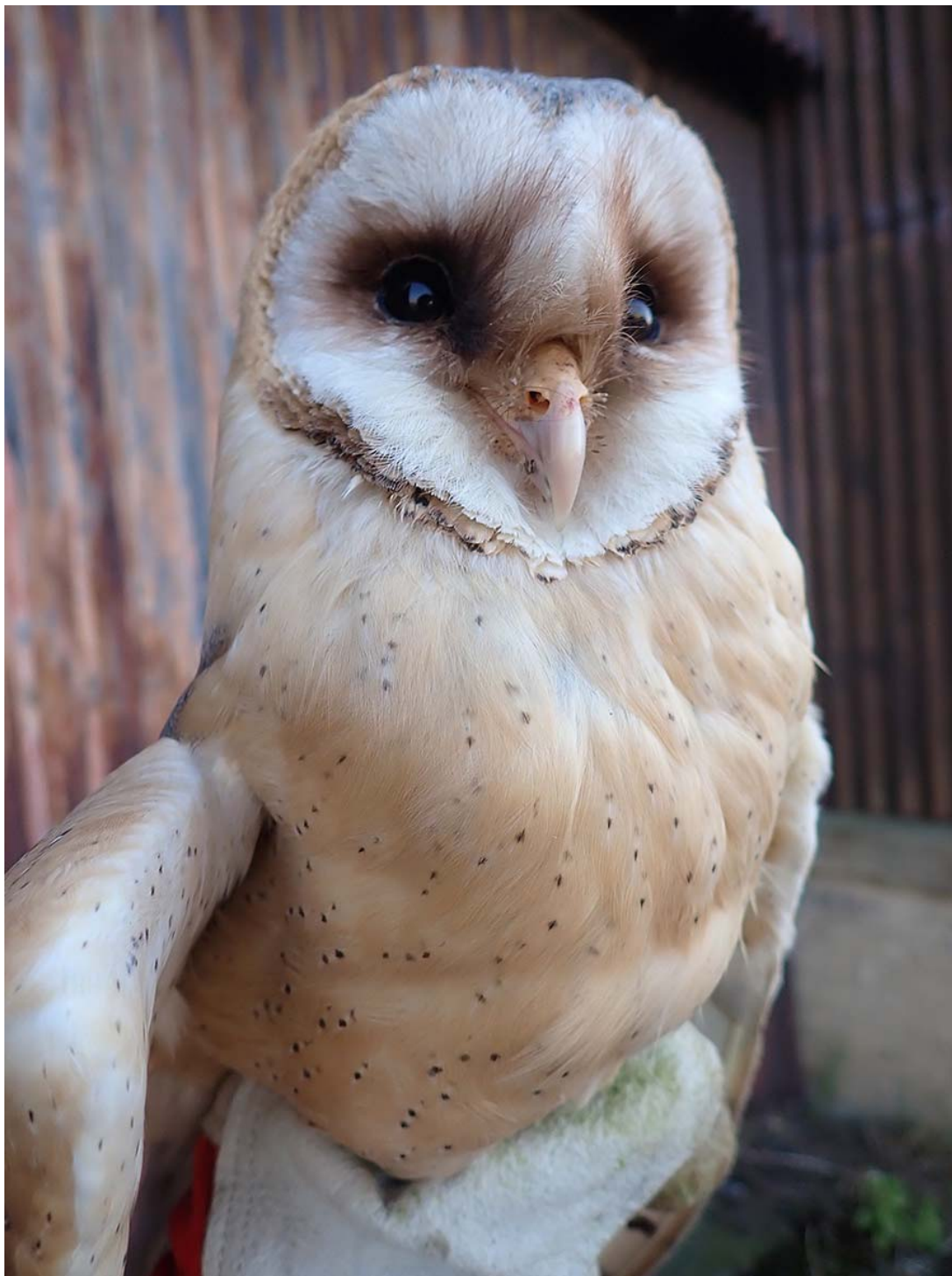
Dospělá hnízdící sova pálená ( Tyto alba ), okres Litoměřice, budka Sova pálená č. 1837.

Společně pro zelenou Evropu Tento projekt byl podpořen grantem z Norských fondů.