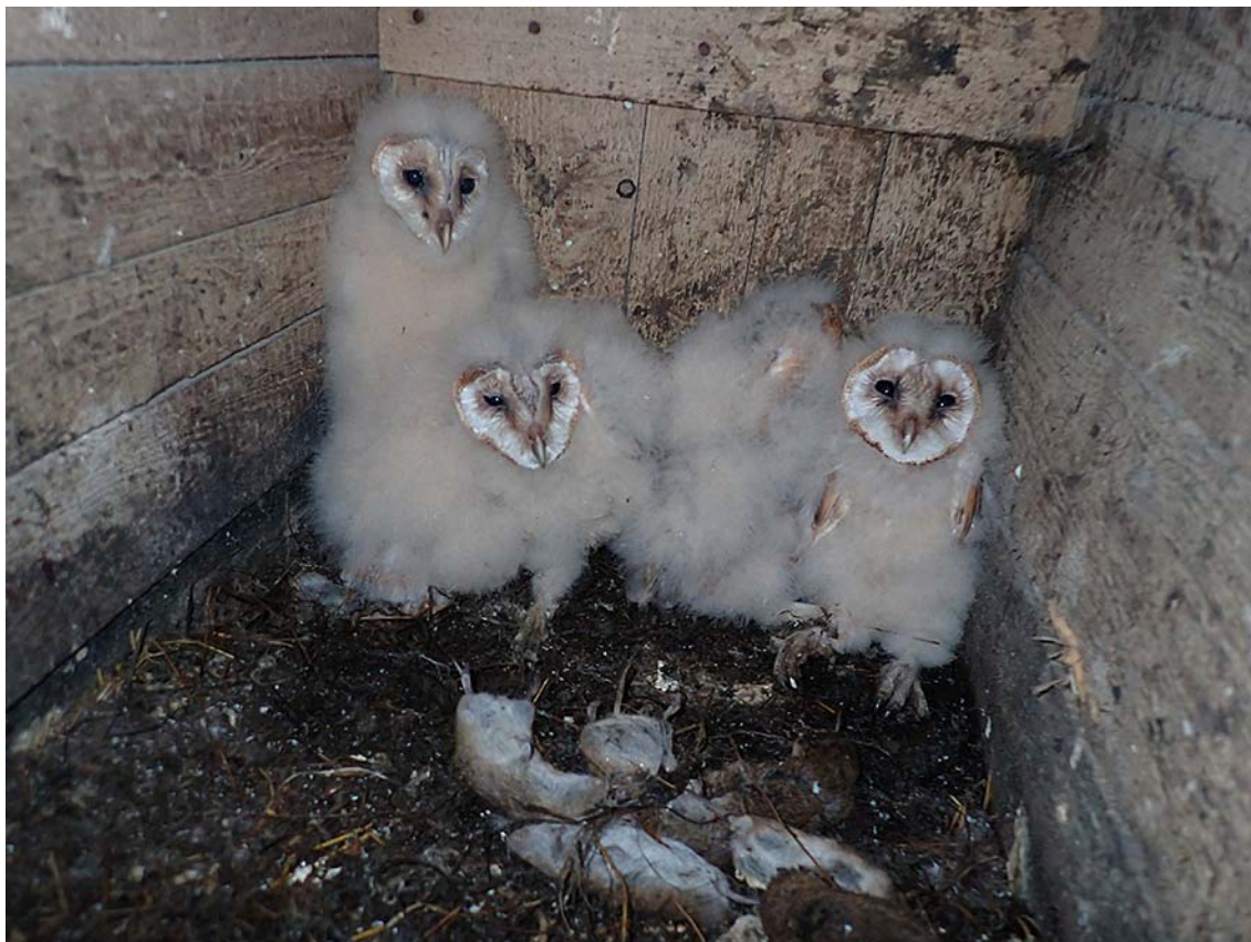
Mláďata sovy pálené ( Tyto alba ), okres Kladno, budka Sova pálená č. 1521.

Společně pro zelenou Evropu Tento projekt byl podpořen grantem z Norských fondů.