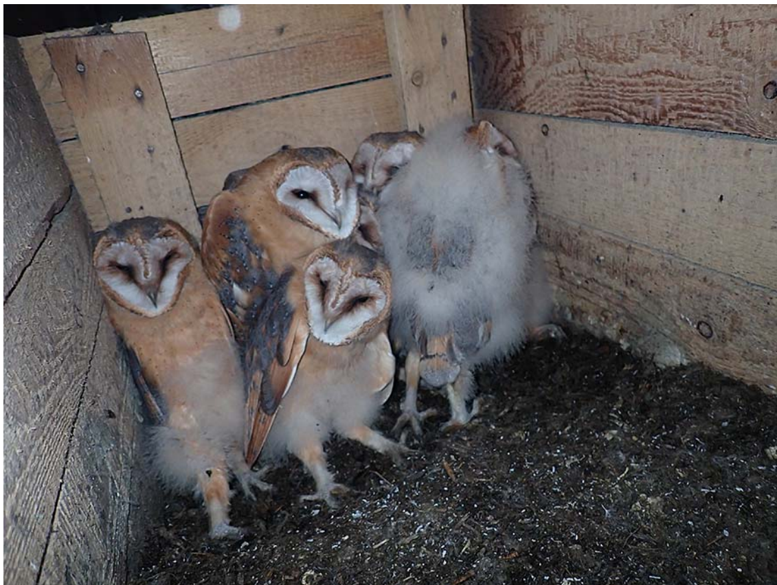
Mláďata sovy pálené ( Tyto alba ), okres Kladno, budka Sova pálená č. 4965.

Společně pro zelenou Evropu Tento projekt byl podpořen grantem z Norských fondů.