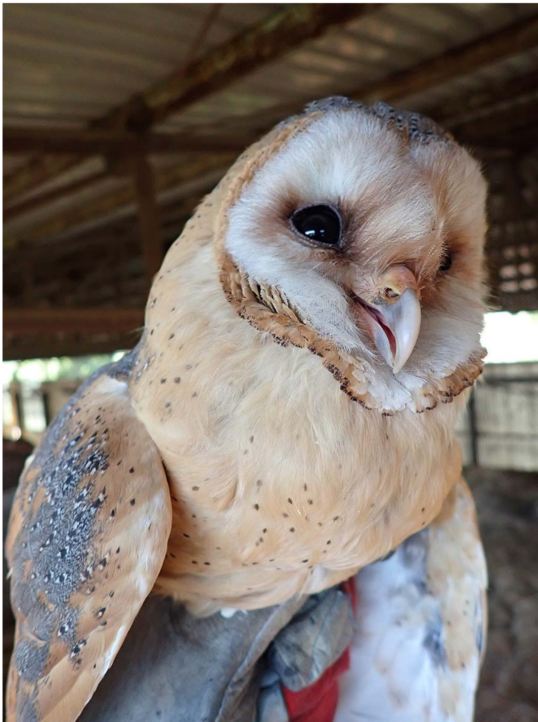
Dospělá hnízdící sova pálená ( Tyto alba ), okres Kladno, budka Sova pálená č. 4914.

Společně pro zelenou Evropu Tento projekt byl podpořen grantem z Norských fondů.