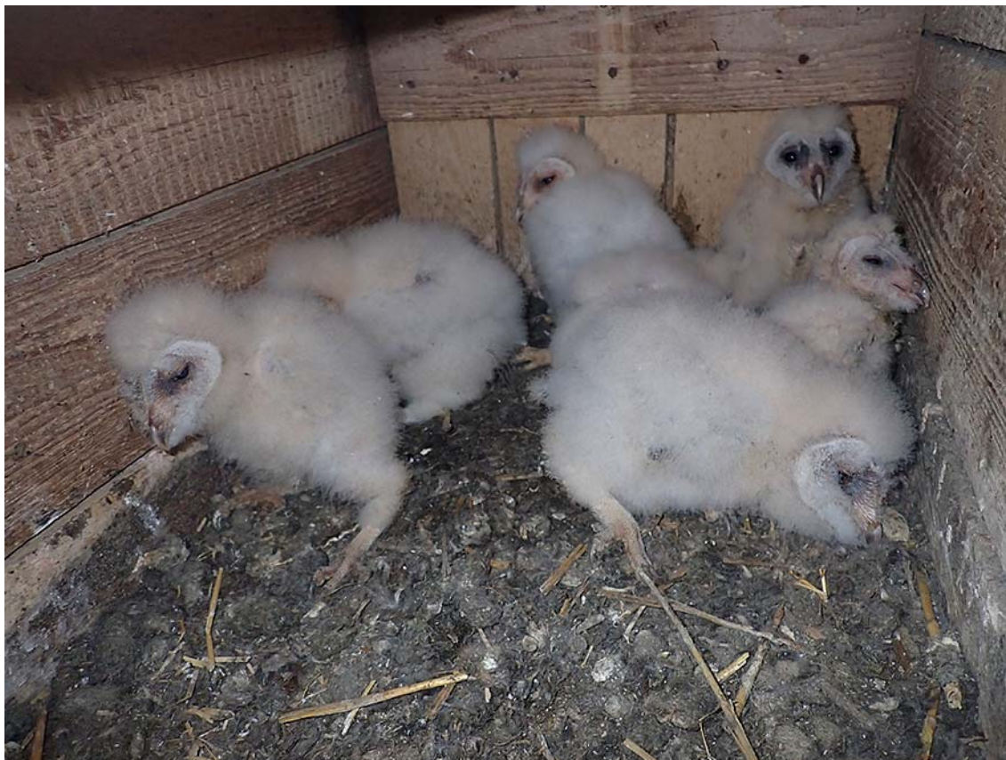
Mláďata sovy pálené ( Tyto alba ), okres Kladno, budka Sova pálená č. 1508.

Společně pro zelenou Evropu Tento projekt byl podpořen grantem z Norských fondů.