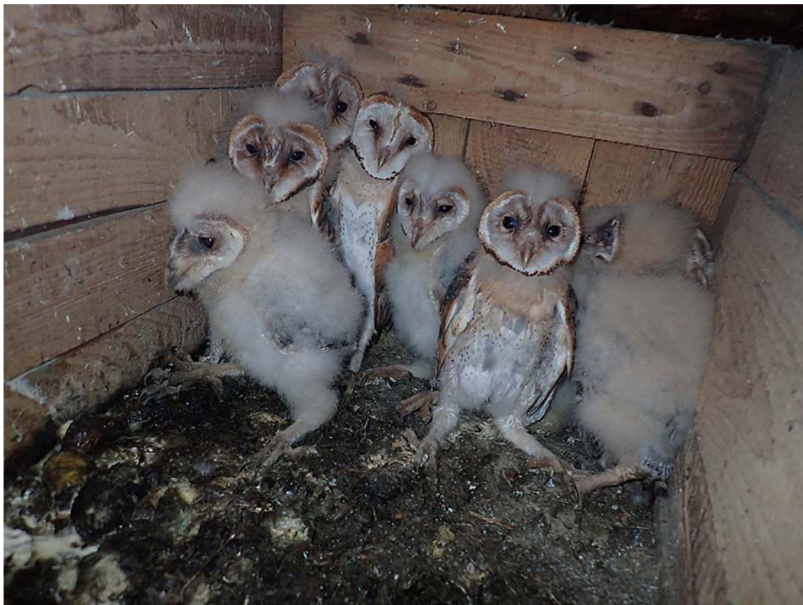
Mláďata sovy pálené ( Tyto alba ) v hnízdní budce po vyčištění a doplnění výstelky, okres Kladno, budka Sova pálená č. 1507.

Společně pro zelenou Evropu Tento projekt byl podpořen grantem z Norských fondů.